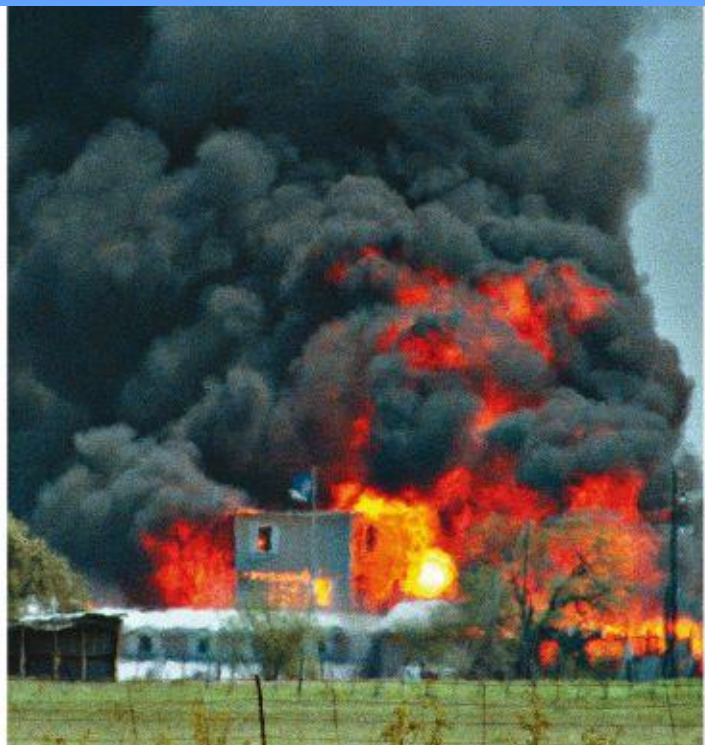
■ 93年4月19日，執法機關強攻「大衛教派」大本營，結果引發大火，76人死亡。