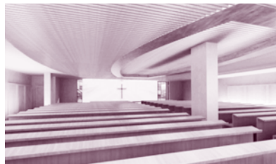
樓上禮堂初步構思

第一步邁前固然重要，第二步邁向那一方向可能比第一步更重要。 物動星移，繁星編織弧形的天空，人觀看造物主指頭所造的寧靜星空，只能無言驚嘆。 在星空之下，我們只不過凡塵，但我們深知上帝住在穹蒼之中，坐著為王。