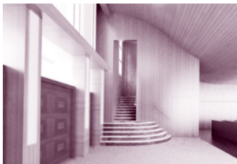
首層大堂入口初步構思